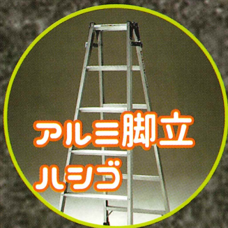
アルミ脚立 立ち馬